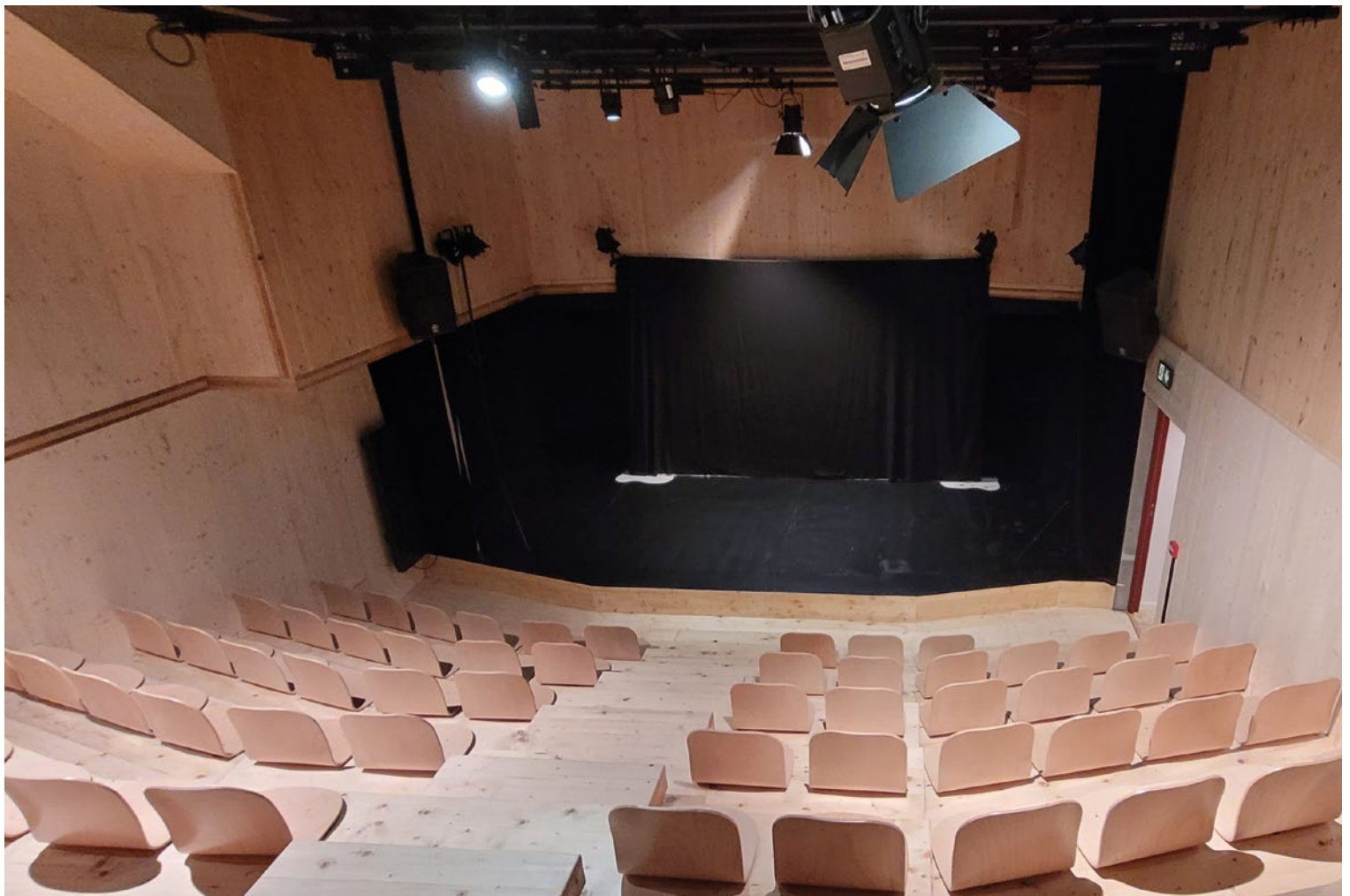
Le projet l'Île Ô est un théâtre flottant comprenant deux amphithéâtres, tout en bois français.