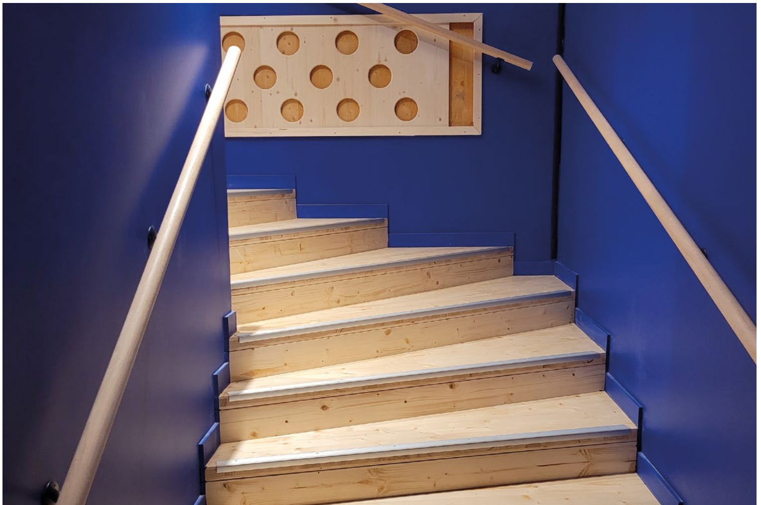
Les 200m 3 de CLT et de lamellé-collé livrés par Schilliger Bois sont presque partout visibles de l'intérieur.