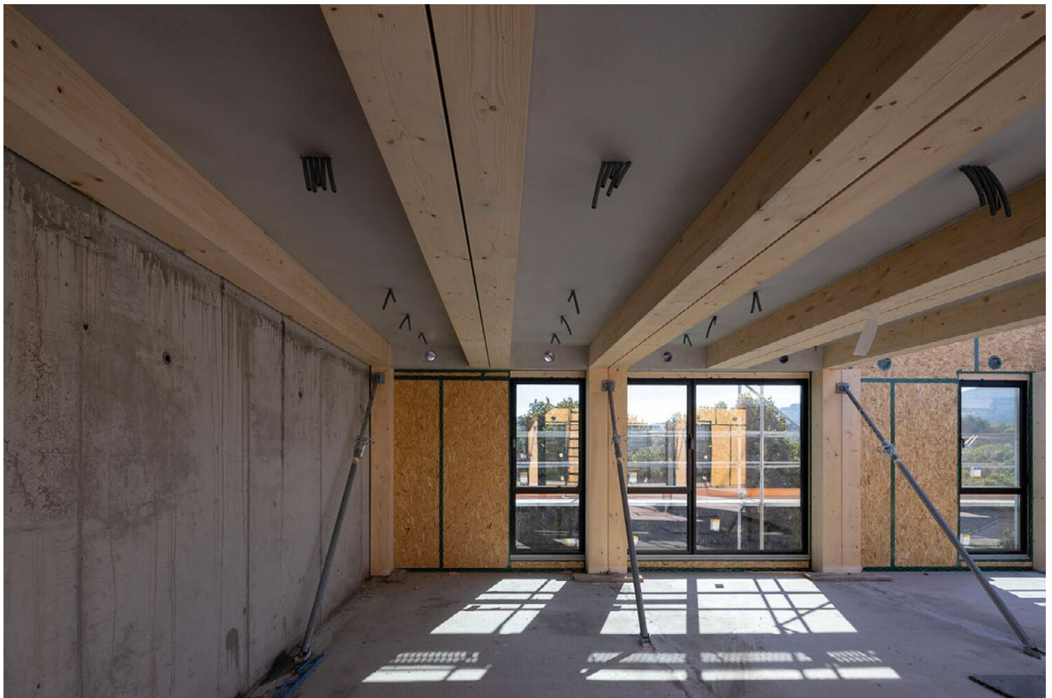
Les composants hybrides bois-béton lors du montage et après le montage.