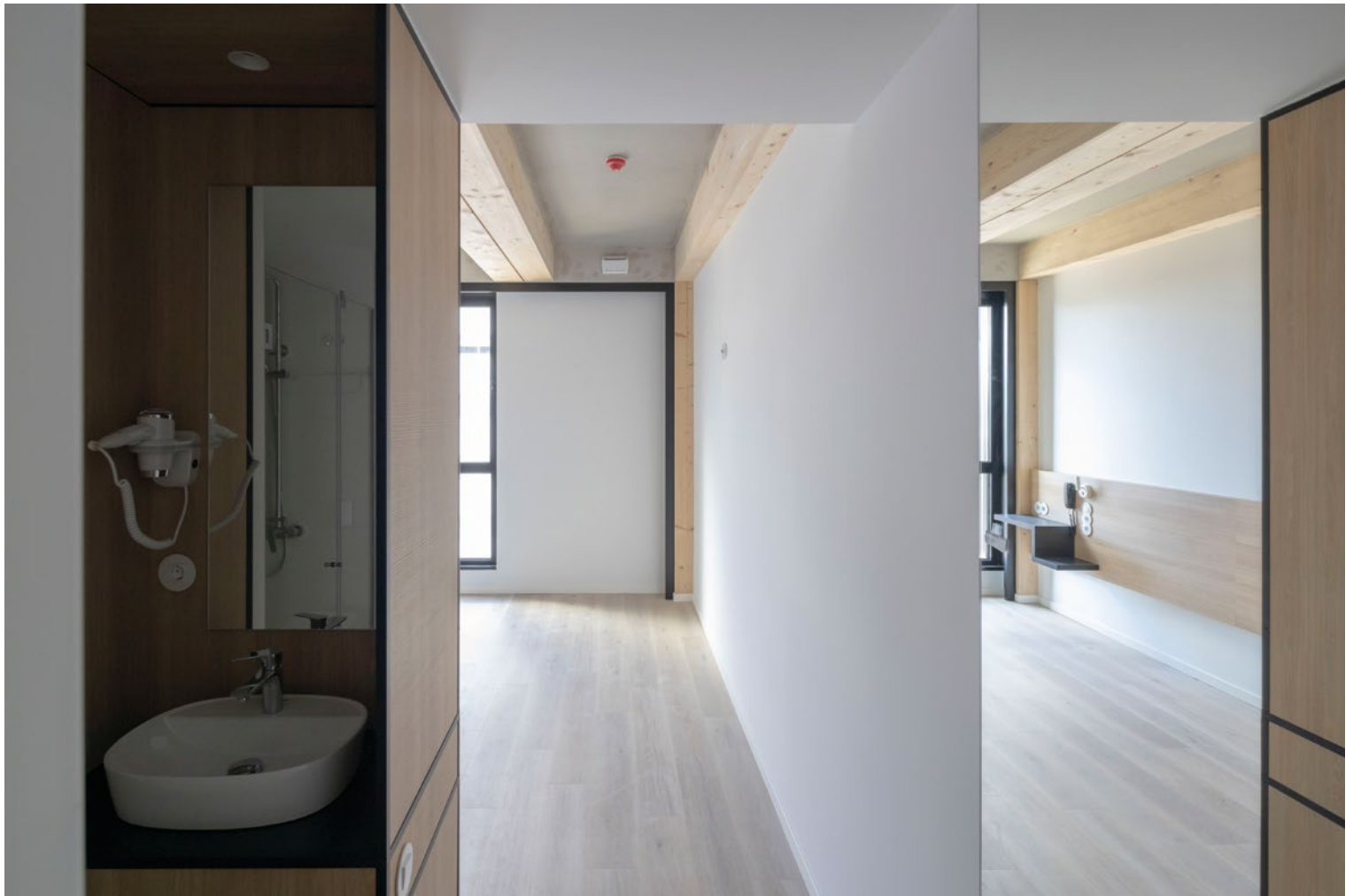
Das Hôtel B&B Guimarães: Smart von aussen und von innen.