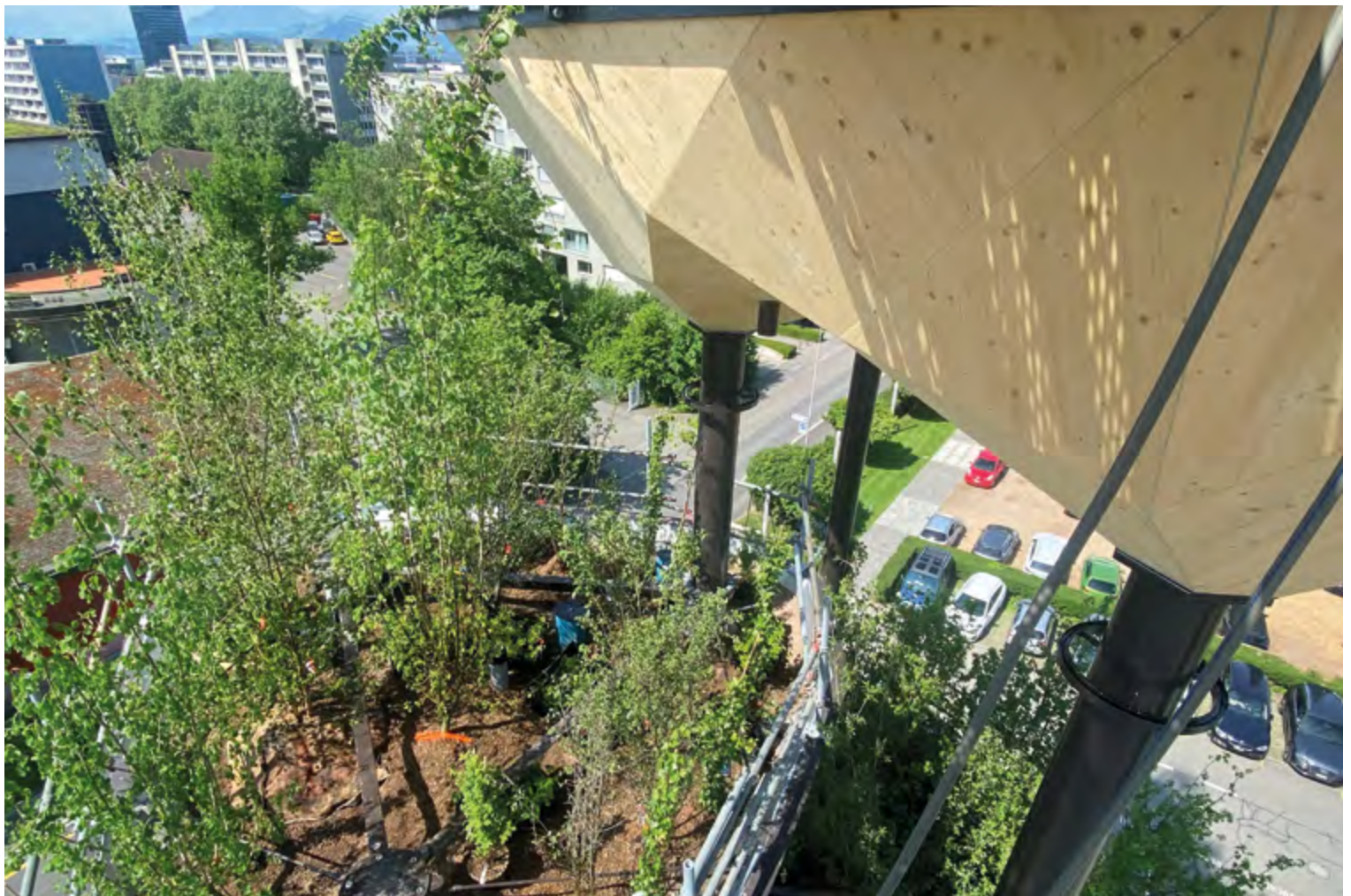
Eine der Schalen vor und nach der Begrünung.