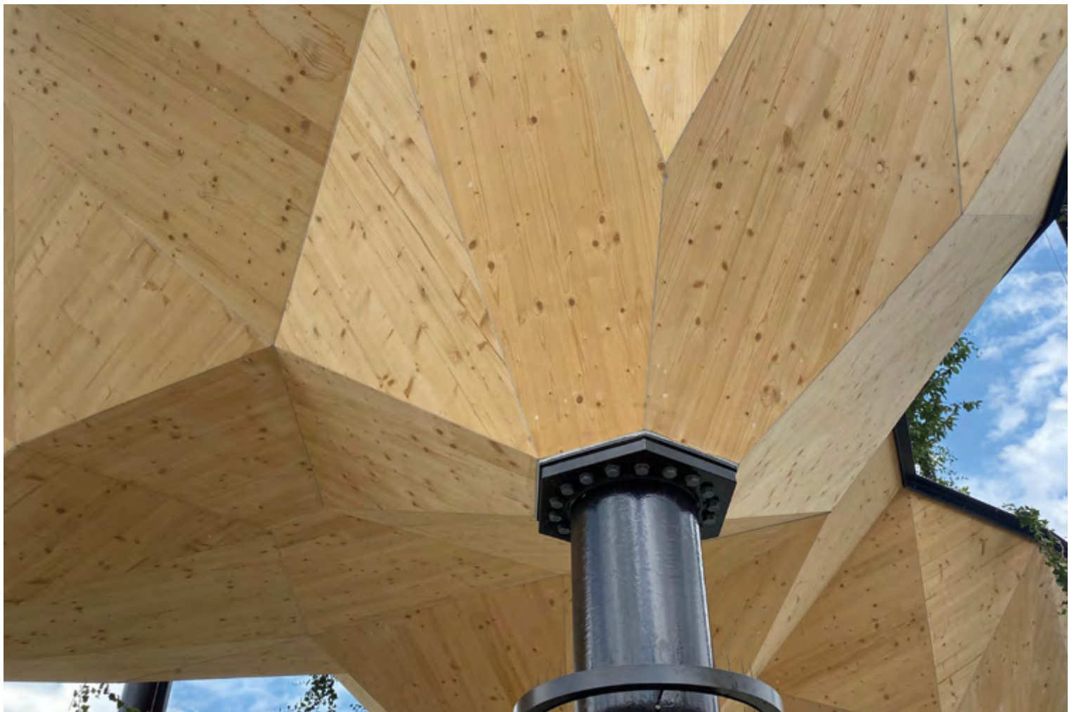
Die 5 überdimensionalen begrünten Schalen wurden einzeln robotisch gefertigt und mit Hilfe der TS3-Technik von Timbatec verklebt.