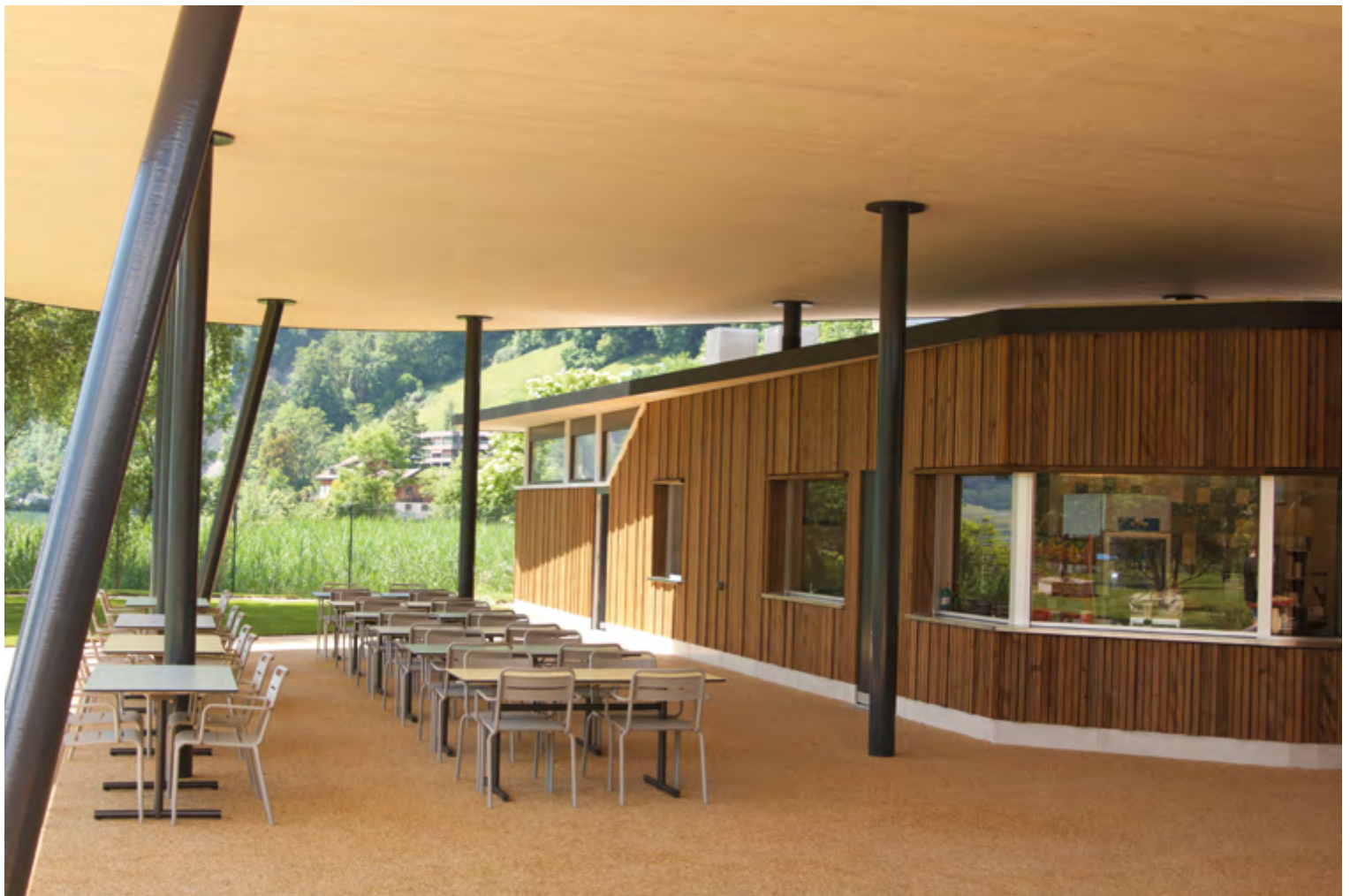
Grâce au collage sur chant avec le système TS3, des poteaux sont uniquement nécessaires tous les 8x8 mètres.