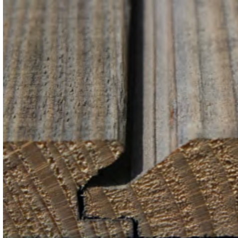
Hobelware aussen und innen