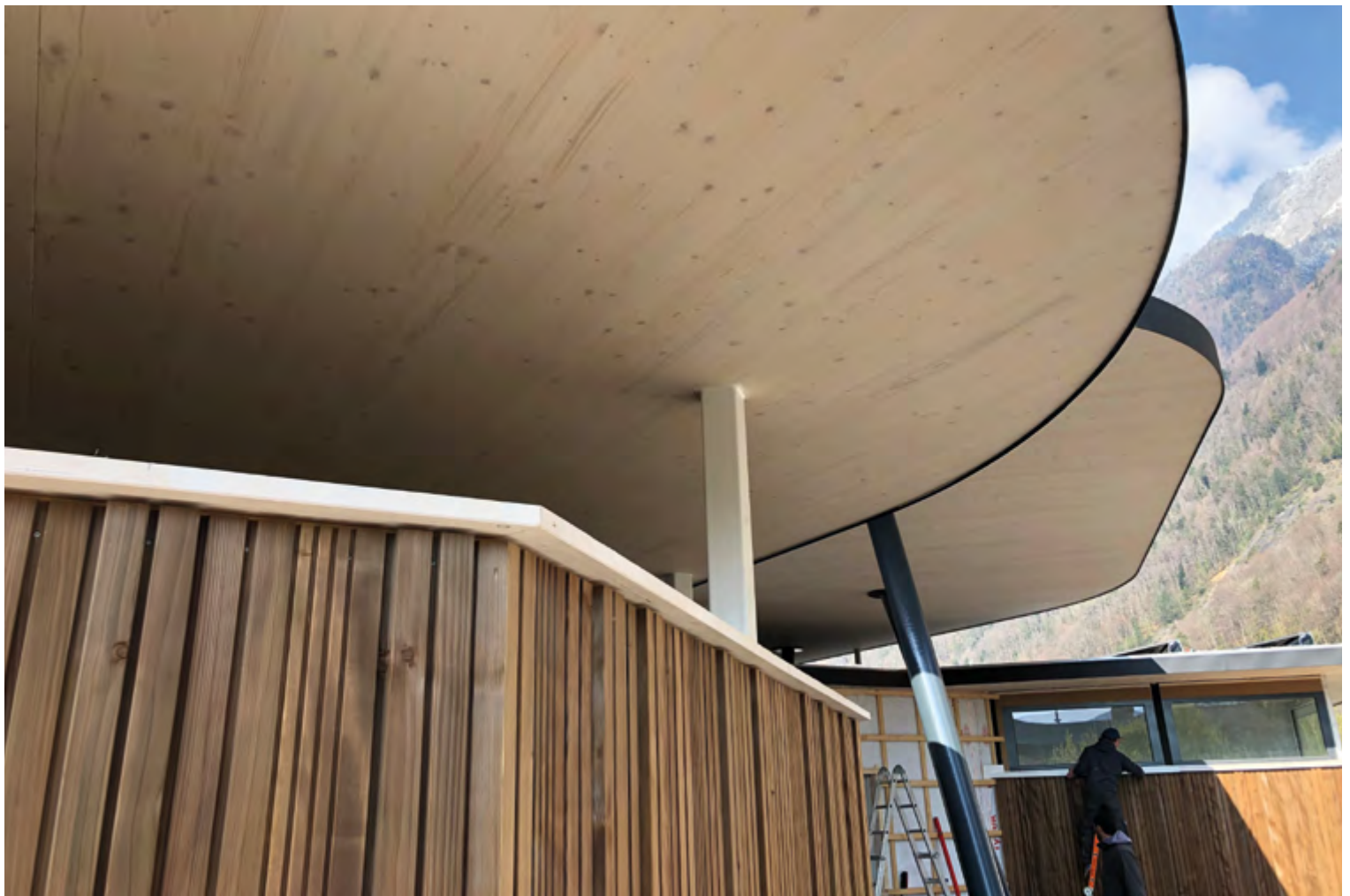
Die Verbindung zwischen zwei Platten (hier links im Bild) ist kaum sichtbar.