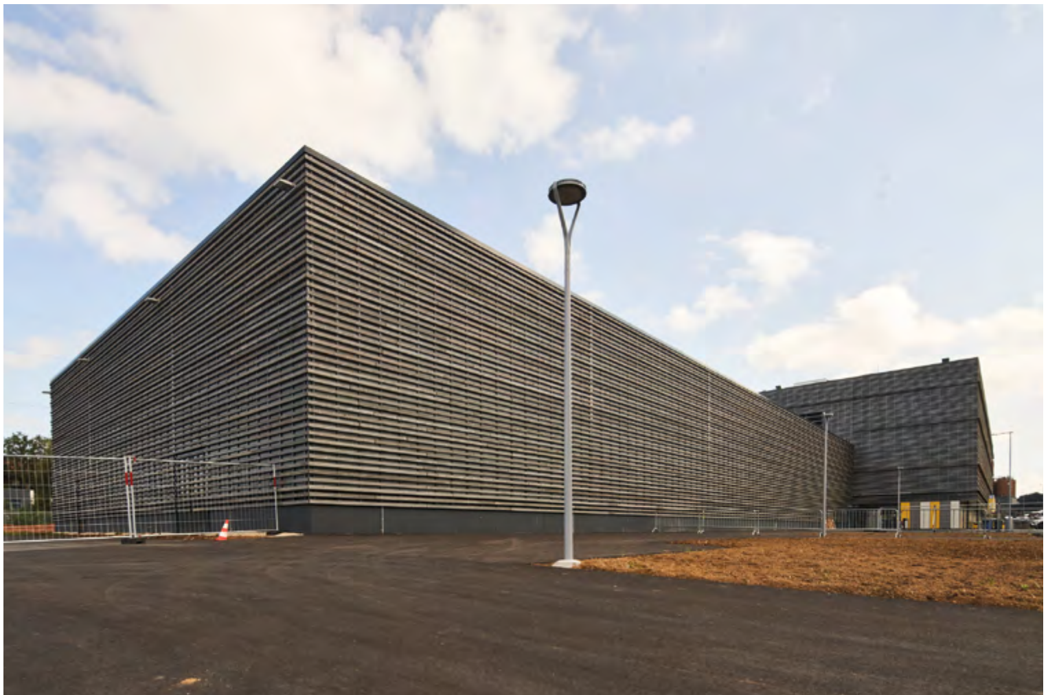
Von aussen erscheint die Halle massiv und doch elegant.