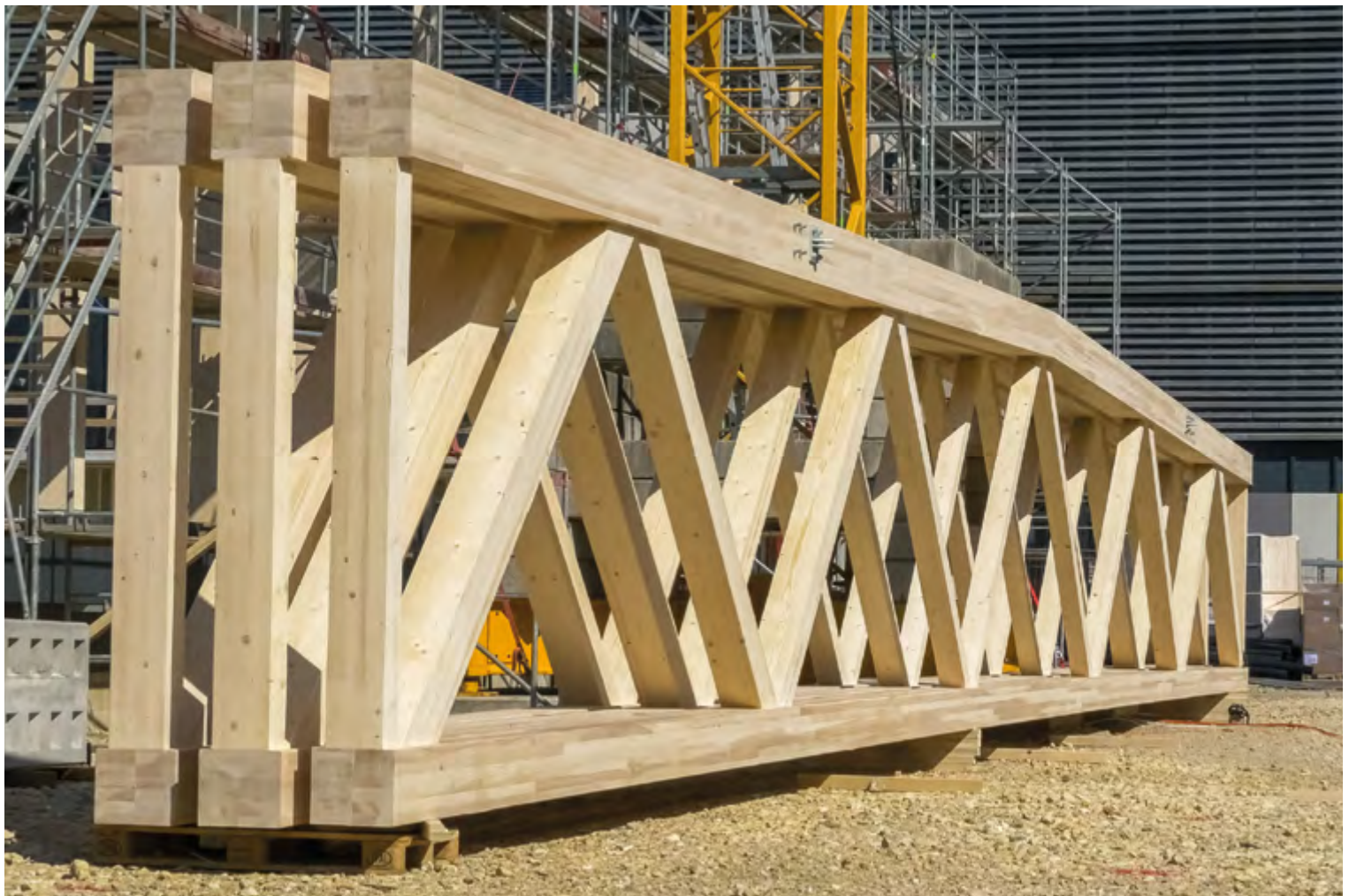
Massive Holzträger überspannen die Halle.