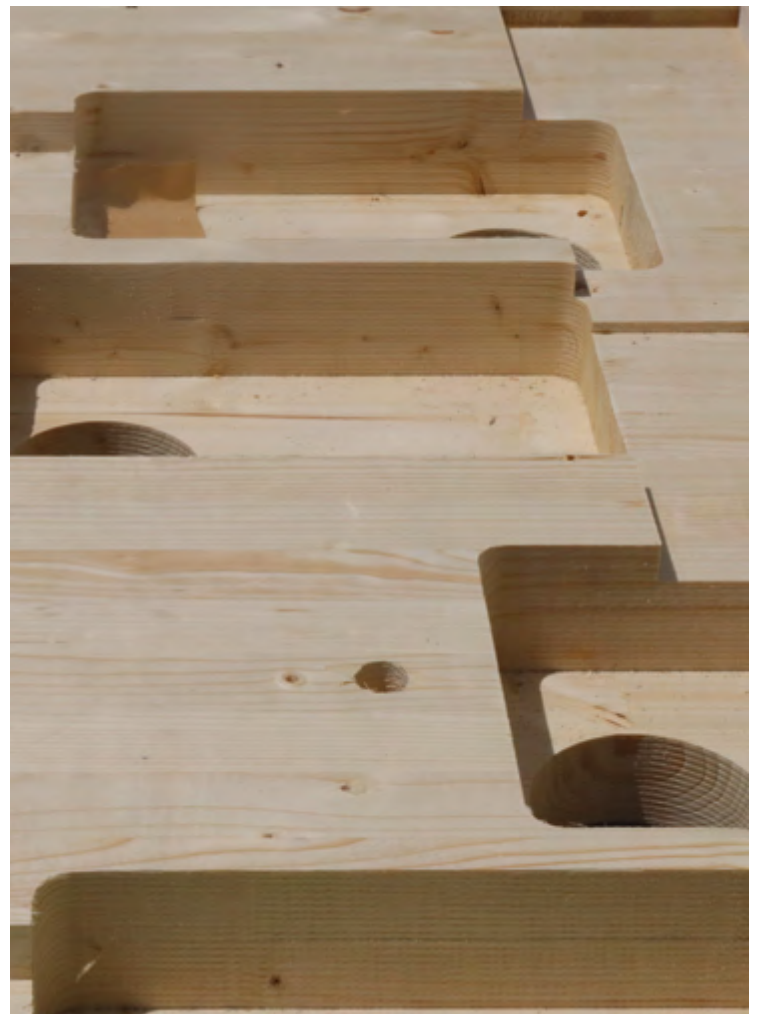
Pour les quatre maisons Schilliger Holz AG a pu produire et tailler plus de 5600 m 2 de dalles en bois massives MHP.