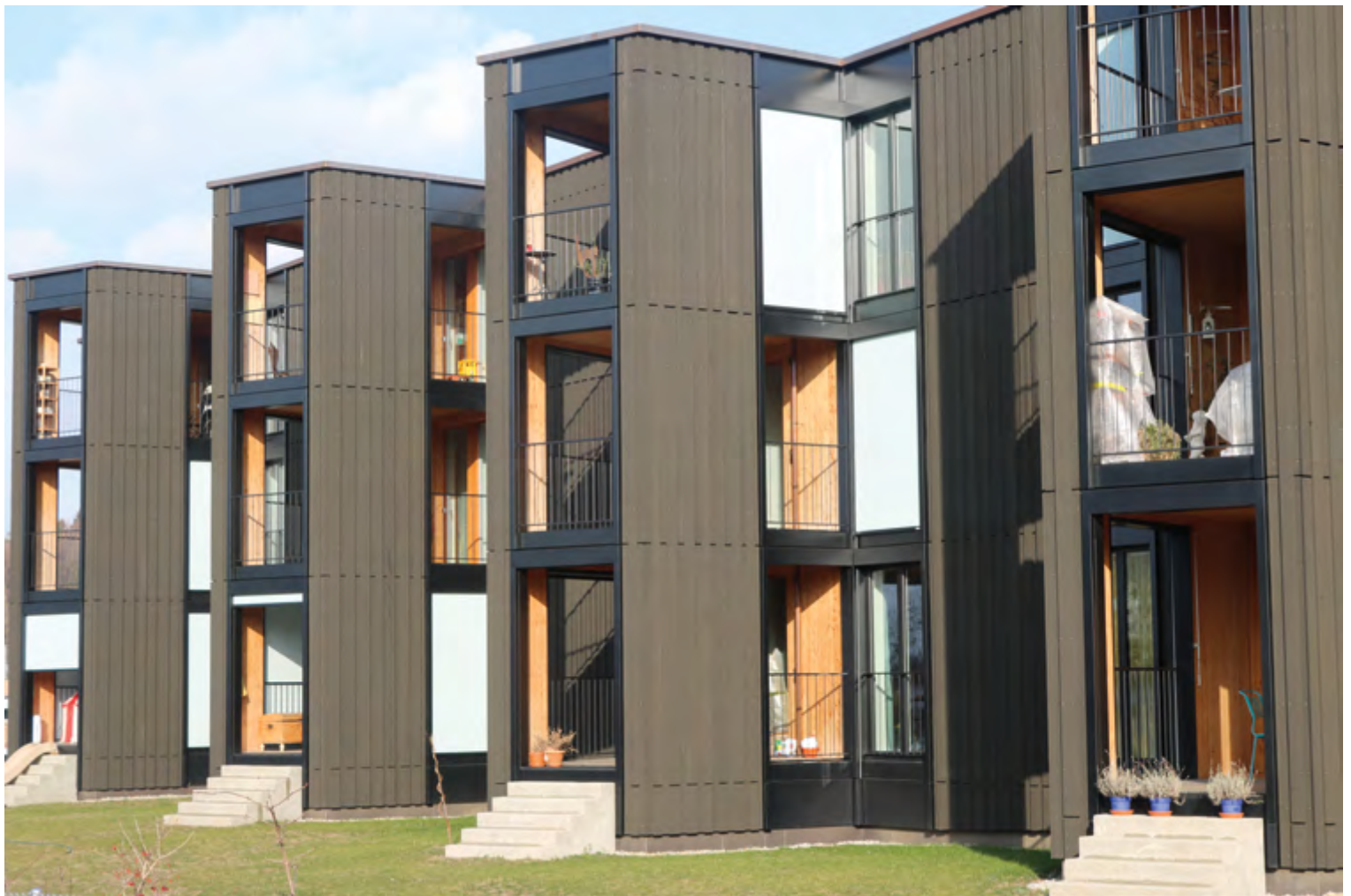
Der rötliche Farbton der Douglasie-Grossformatplatten harmoniert perfekt mit der in blaugrau gehaltenen Fassade.