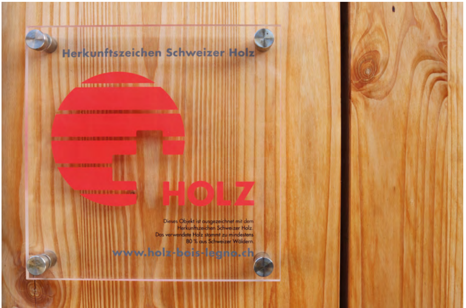
Herkunftszeichen Schweizer Holz: Standard im innovativen Holzbau.