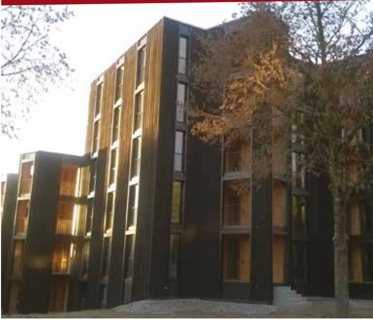
Terrasses couvertes en PMC douglas, jusqu'à 5 étages (Wintherthur, Suisse)