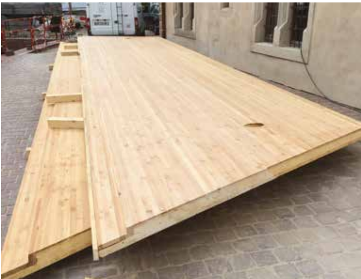
Toiture PMC en mélèze (Colmar, France)

Les panneaux PMC peuvent être produits à partir de plusieurs essences résineuses, et selon différentes qualités esthétiques. Sublimez vos intérieurs et vos extérieurs en jouant sur cette incroyable palette naturelle de teintes et de textures.