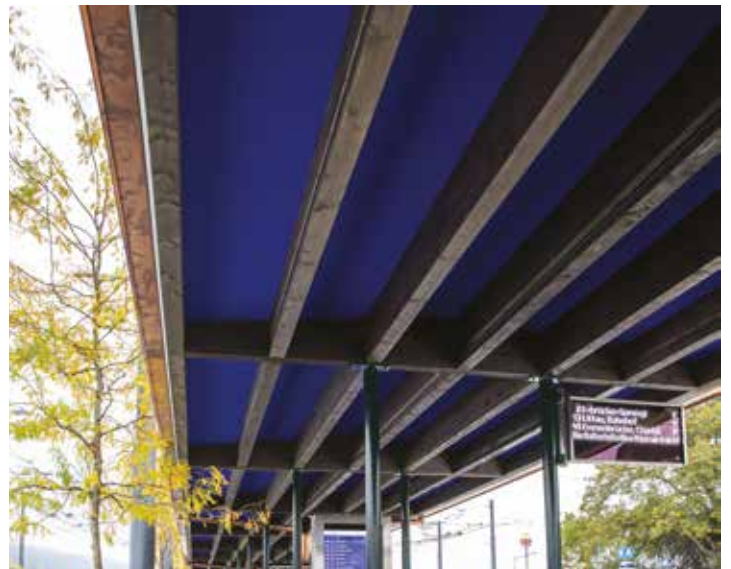
Toiture PMC visible peinte (Emmen, Suisse)