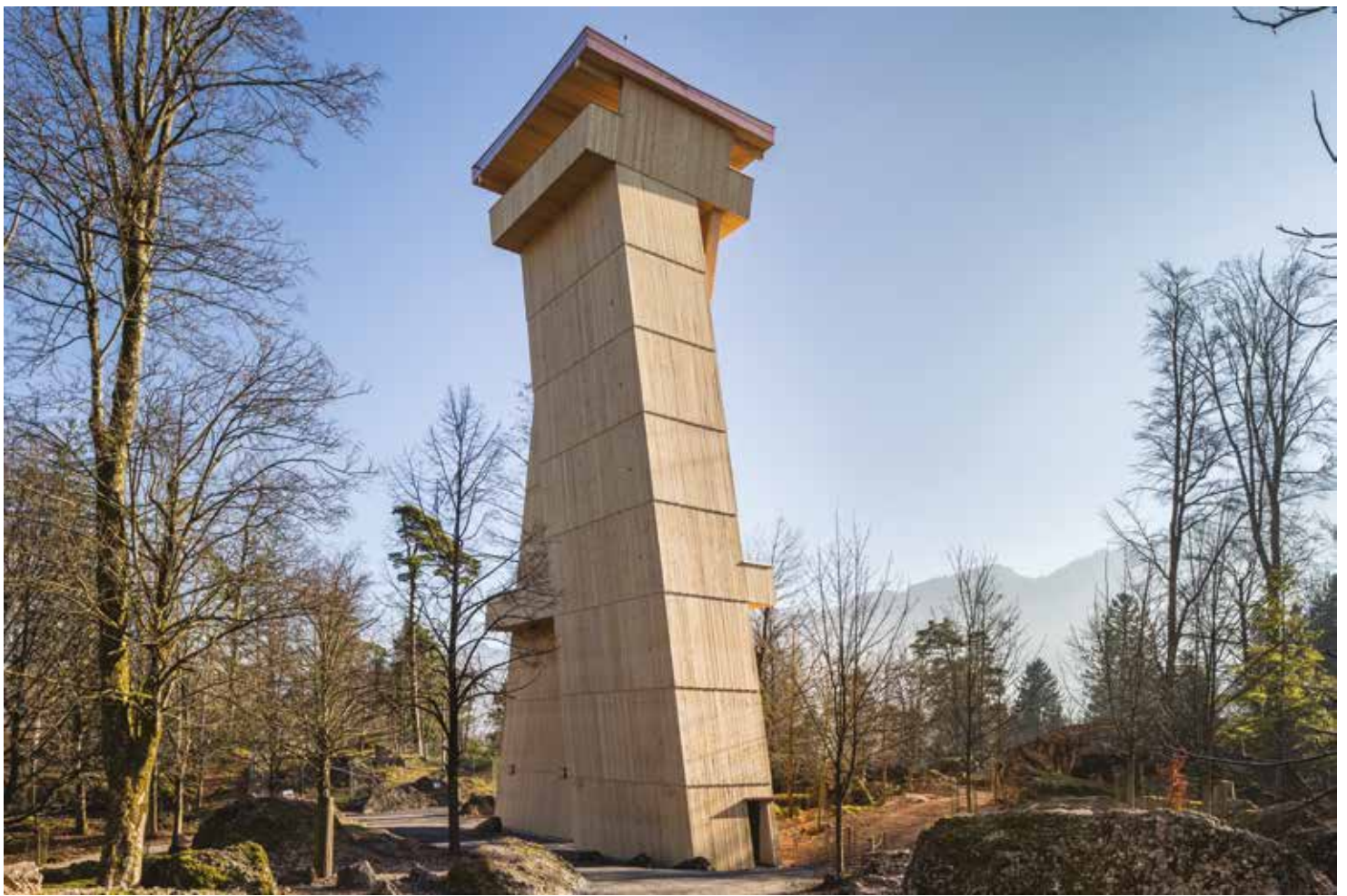
Tour d'observation de 30 mètres de hauteur en lamellé-collé et PMC (Goldau, Suisse)

Le PMC peut être mis en œuvre dans des projets aux exigences structurelles très élevées. Notre bureau technique se tient à votre disposition pour vous conseiller et adapter la composition des plis selon les critères techniques et économiques du projet.