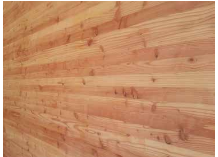
Mur PMC en mélèze (Paray-le-Monial, France)

Les panneaux PMC peuvent être produits à partir de plusieurs essences résineuses, et selon différentes qualités esthétiques. Sublimez vos intérieurs et vos extérieurs en jouant sur cette incroyable palette naturelle de teintes et de textures.